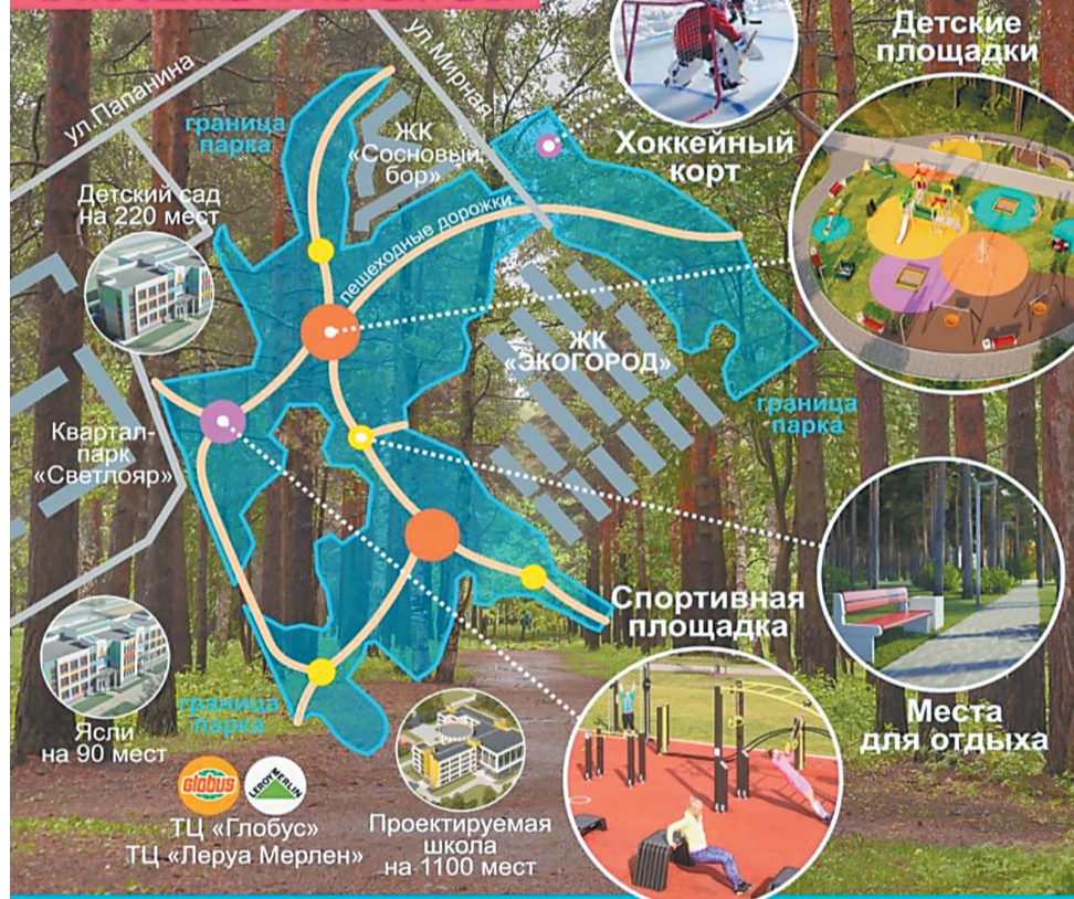
Эскиз «Экопарка» в Заволжском сельском поселении, представленный в день голосования по проекту «Решаем вместе!»