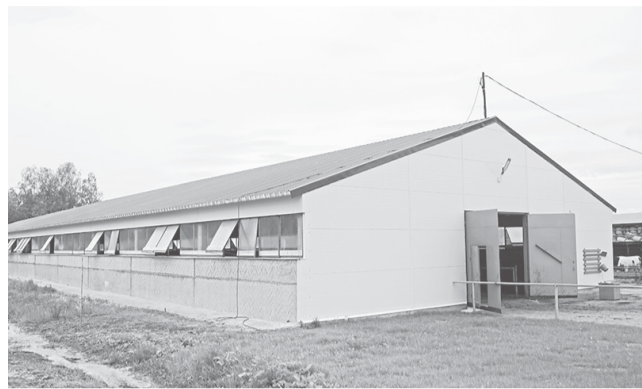
Новый двор в ООО «Племзавод «Родина»

при интенсивном использовании концентратов.