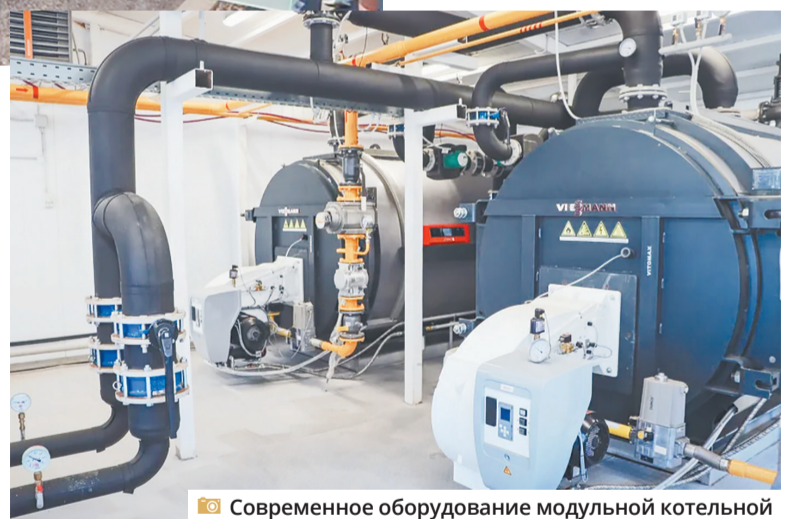
Современное оборудование модульной котельной

В котельных смонтированы надежные водогрейные котлы, дымовые трубы, установлены теплообменники и насосы, а также современные системы очистки воды. Оборудованы помещения для резервного дизельного топлива и противопожарные перегородки из сэндвич-панелей.