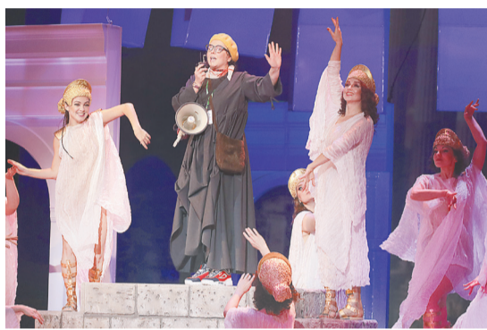
Фестиваль открыл спектакль «Забыть Герострата»