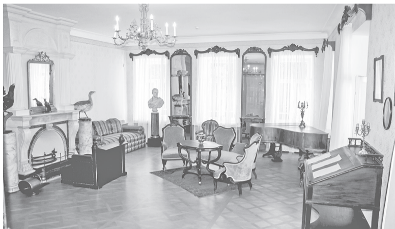
Восточный флигель. Гостиная.

стали определяющими при покупке им усадьбы, но все же в глазах поэта вполне придавали ей особое очарование. Именно в Карабихе будет создана поэма «Русские женщины», где в описании начала пути княгини Марии Волконской в Сибирь пересекутся и пушкинская, и декабристская темы. Героиня вспомнит «крымские каникулы», проведенные однажды в юности с молодым поэтом, и встречу с Пушкиным через несколько лет в Москве в салоне Зинаиды Волконской, откуда она увезет переданное им «Послание в Сибирь». Стоит сказать, что и князь Валериан Голицын тоже станет персонажем литературного текста. Правда, произойдет это гораздо позже, в 1911 году, в романе «Александр I» писателя-философа Д.С. Мережковского.