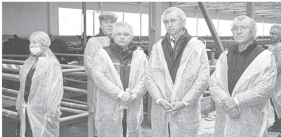
На открытии отделения «Курба»

Первый двор вмещает 480 голов – четыре секции по 120 мест. Раньше система вентиляции не позволяла полноценно поступать воздуху. Эту проблему устранили, сделали большие окна.