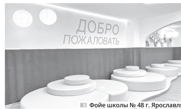
Фойе школы № 48 г. Ярославля

вают, но и выбирают на общешкольных голосованиях. Они организованы в соответствии с рекомендациями Роспотребнадзора, часть мероприятий проходит в дистанционном формате.