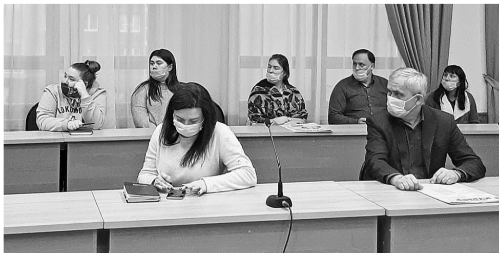
☒ Слушания по Уставу района

В соответствии с действующим федеральным законодательством речь идет об изменении перечня вопросов местного значения. Это касается дорожной деятельности, муниципального контроля на автотранспорте, мер пожарной безопасности, выполнения кадастровых работ, контроля за исполнением единой теплоснабжающей организацией обязательств по строительству, реконструкции и модернизации