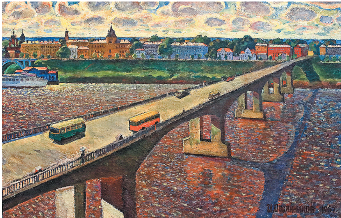
Волга. Мост. 1967 год