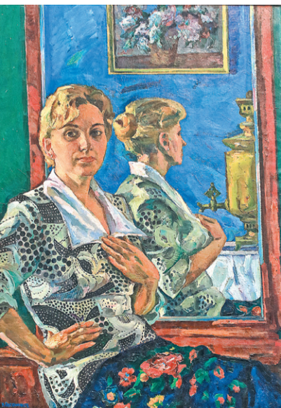
Портрет жены перед зеркалом. 1978 год

– На этой картине вижу себя в 12 лет. Вспоминаю, как позировала с барабаном – довольно трудное занятие. Каждый вечер папа делал вечером наброски после работы. Благодаря им все детские годы не толь-