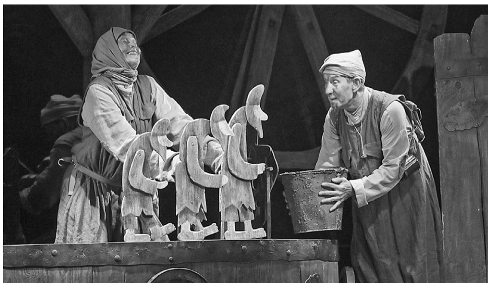
Спектакль «Кому на Руси жить хорошо...»