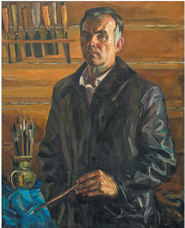
Автопортрет в кожаной куртке. 1985 год