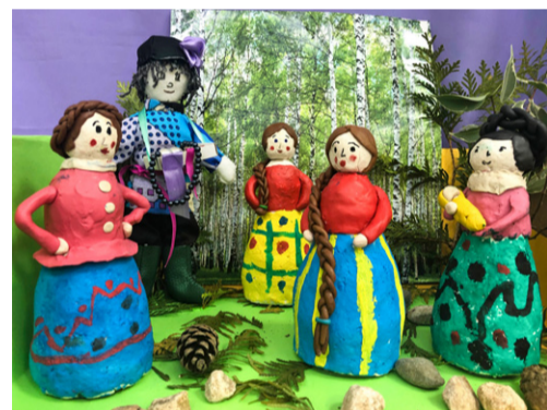
Любительское объединение «Умелые ручки». Работа «Коробейники»

год собирает библиотекарей и читателей – любителей цветоводства, садоводства и ландшафтного дизайна. В сельской местности палисадник – это визитная карточка дома! В Некрасовский год тематика стала соответствующей. Онлайн-формат позволил снова охватить все уголки России – в конкурсе участвовали жители Брянской, Курской, Ярославской областей, Красноярского края и Республики Крым.