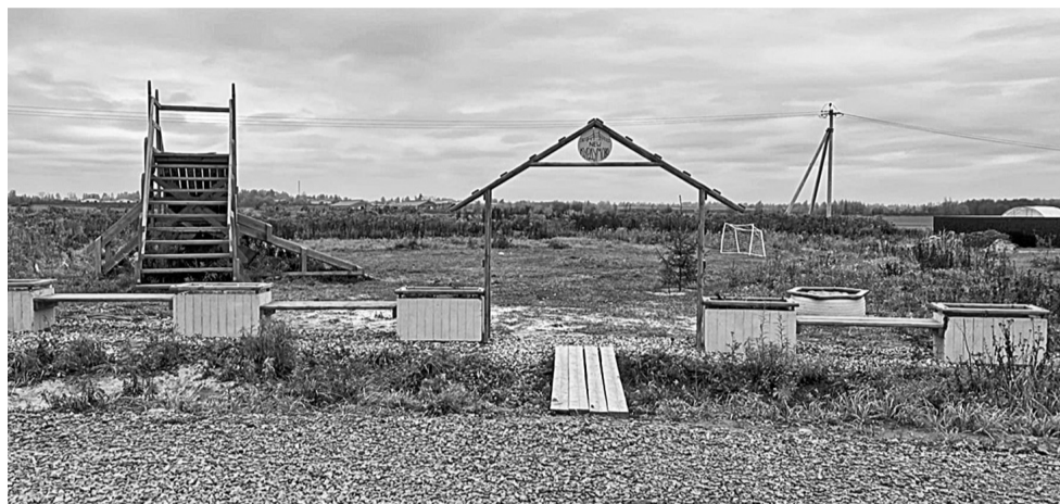
☐ Детская площадка в д. Курдумово

остановки транспорта, мостики, родники, въездные группы, информационные стенды и территория вокруг них и т.п.