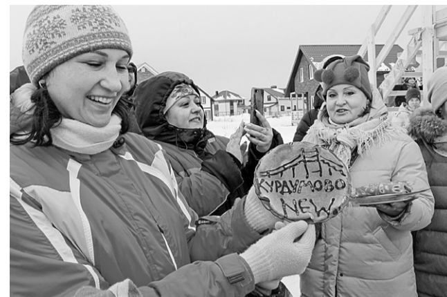
☐ Масленица-2021. Презентация логотипа д. Курдумово