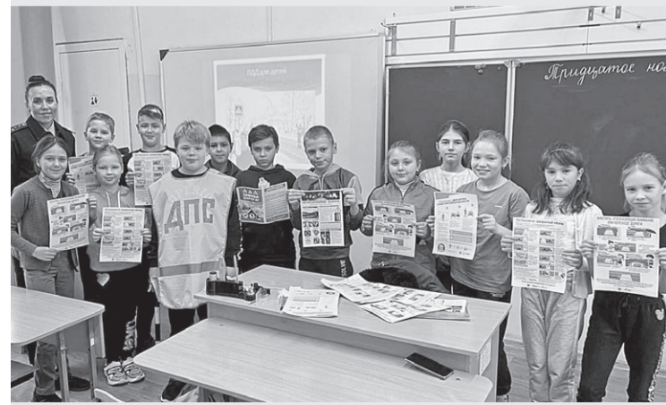
Школьники из поселка Заволжье знают дорожную азбуку

А в средней школе села Спас-Виталий проведена беседа с учащимися 5-10 классов на тему «Правила для пешеходов, пассажиров и водителей. Все ли мы знаем?». Мероприятие также организовано в рамках профилактики детского дорожно-транспортного травматизма.