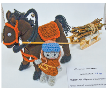
Выставка-конкурс «Есть и Руси чем гордиться». Работа «Мужичок с ноготок»

К 200-летию со дня рождения Николая Алексеевича Некрасова сотрудники домов культуры и библиотек Ярославского района провели много интересных мероприятий.