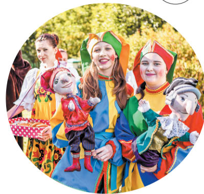
День района. Встреча гостей

В первые недели декабря в рамках Некрасовских дней проходит флэер-акция «Читай Некрасова!». Библиотекари и волонтеры района в костюмах героев произведений поэта раздают жителям поселков, сел и деревень буклеты-флэеры, открытки с символикой книг и раскраски для детей.