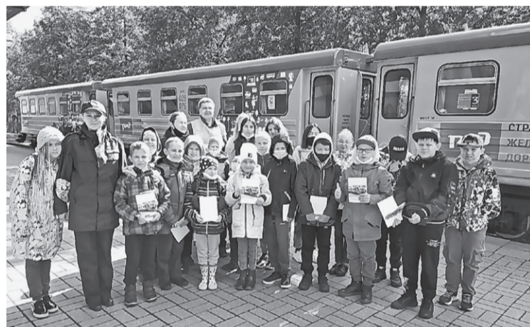
Мокеевские школьники на детской железной дороге

Организация таких мероприятий требует времени и сил. Но результаты того стоят. Педагоги из Мокеевского взяли за правило выпускать в жизнь образованных и самостоятельных молодых людей, вкладывая в обучение и воспитание свой труд и душу. Спасибо им за это!