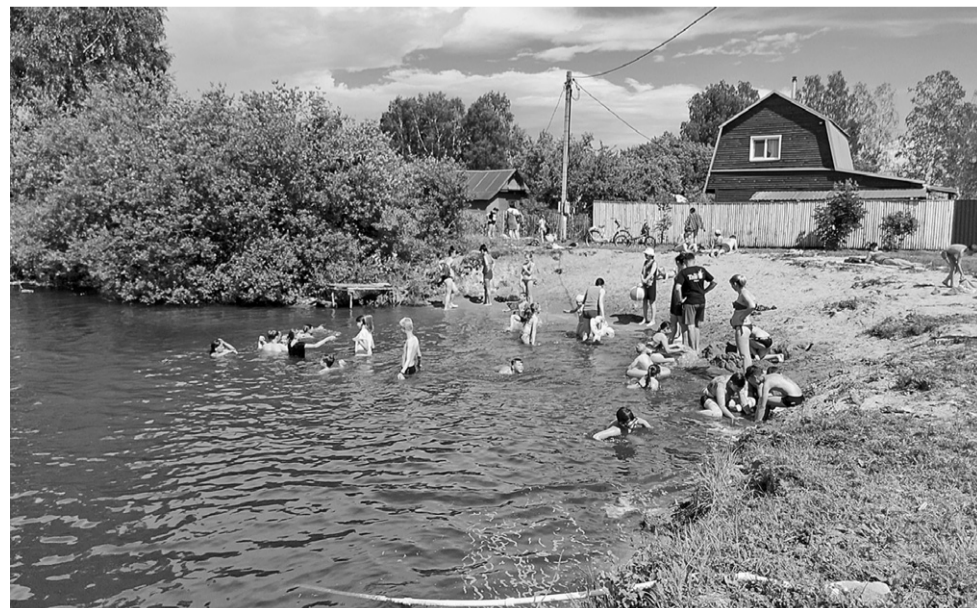
☐ Садовский пруд в д. Кузнецкиха