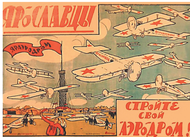
Плакат 20-х годов XX века