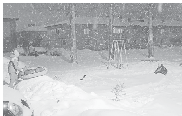
Так двор, где будет установлена новая спортивно-игровая площадка, выглядит сегодня. Летом картина изменится