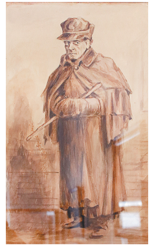
С.В. Шуйский в роли Крутицкого. Императорский Малый театр. Москва. 1872 год

сыгравших главные роли в разных театрах страны, фотографии сцен из спектаклей. Шестнадцать экспонатов выставки – подлинники.