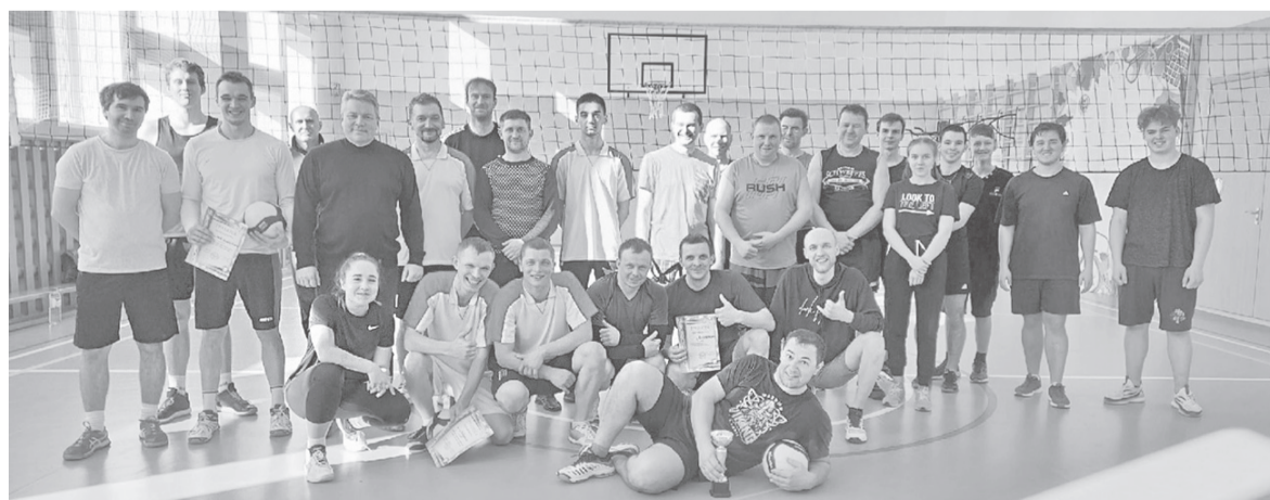
Подготовил Борис Куфирин

Это первенство – второе по счету, и любители спорта надеются, что оно станет традиционным и будет собирать еще больше команд.