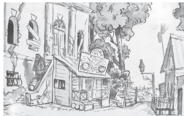
Борис Кустодиев. Эскиз декорации. Петроград. 1921 год

Выставка «Денежный вопрос» знакомит посетителей с героями произведения Островского, актуального и в наши дни. В экспозиции можно увидеть эскизы декораций к спектаклям, поставленным по мотивам комедии «Не было ни гроша, да вдруг алтын» от конца XIX века до наших дней. Есть здесь портреты актеров,