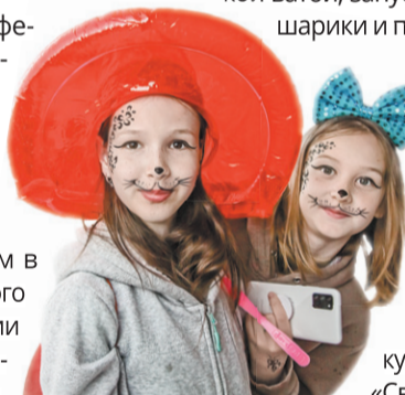
☞ Настроение – летнее, отличное!

Праздничную эстафету подхватили представители концертно-зрелищного центра «Миллениум». В подарок жителям Ивняков они провели киномероприятие «Мы живем в России». В год культурного наследия народов России эта интересная, познавательная программа ознакомила зрителей с фольклором, послови-