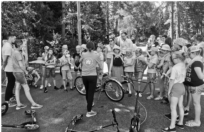
Летние каникулы богаты на события

Одним словом, делается все, чтобы отдых в «Иволге» был достойным.