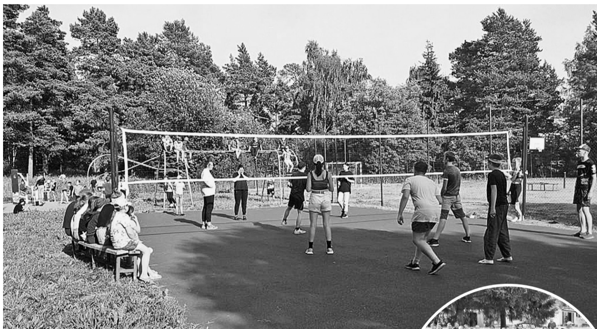
Отдых в «Иволге» разнообразен

мами культуры, библиотеками, учреждениями дополнительного образования.