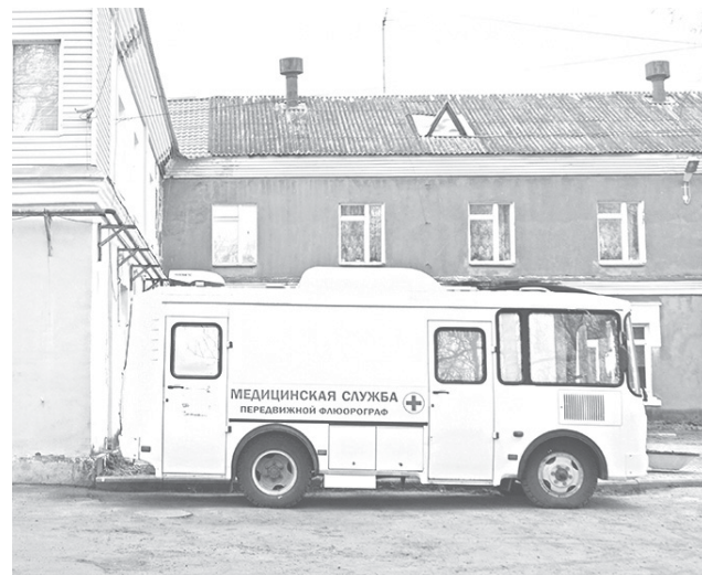
☑ Передвижной флюорограф работает в нашем районе

В преддверии профессионального медицинского праздника хочется поблагодарить всех коллег, несущих бессменную вахту на своих рабочих местах, пожелать крепкого здоровья им и всем жителям нашего родного района!