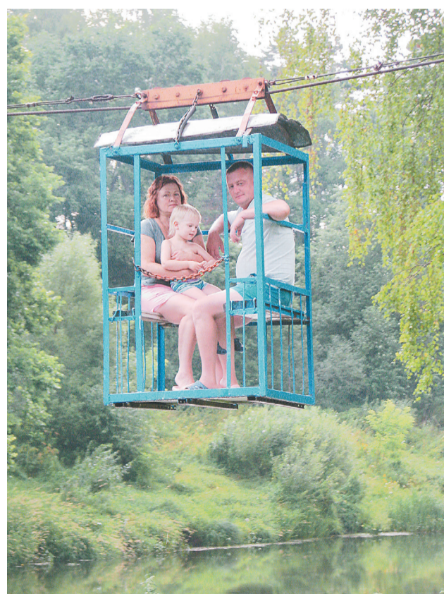
Фуникулер над Которослью

Отец сам делал для детей игрушки. Вспоминаю, как он перед Новым годом под елку положил трамвай, который мигал огоньками, и паровоз, а для сестры – красивый самоварчик. Это было счастье – получить такие подарки!