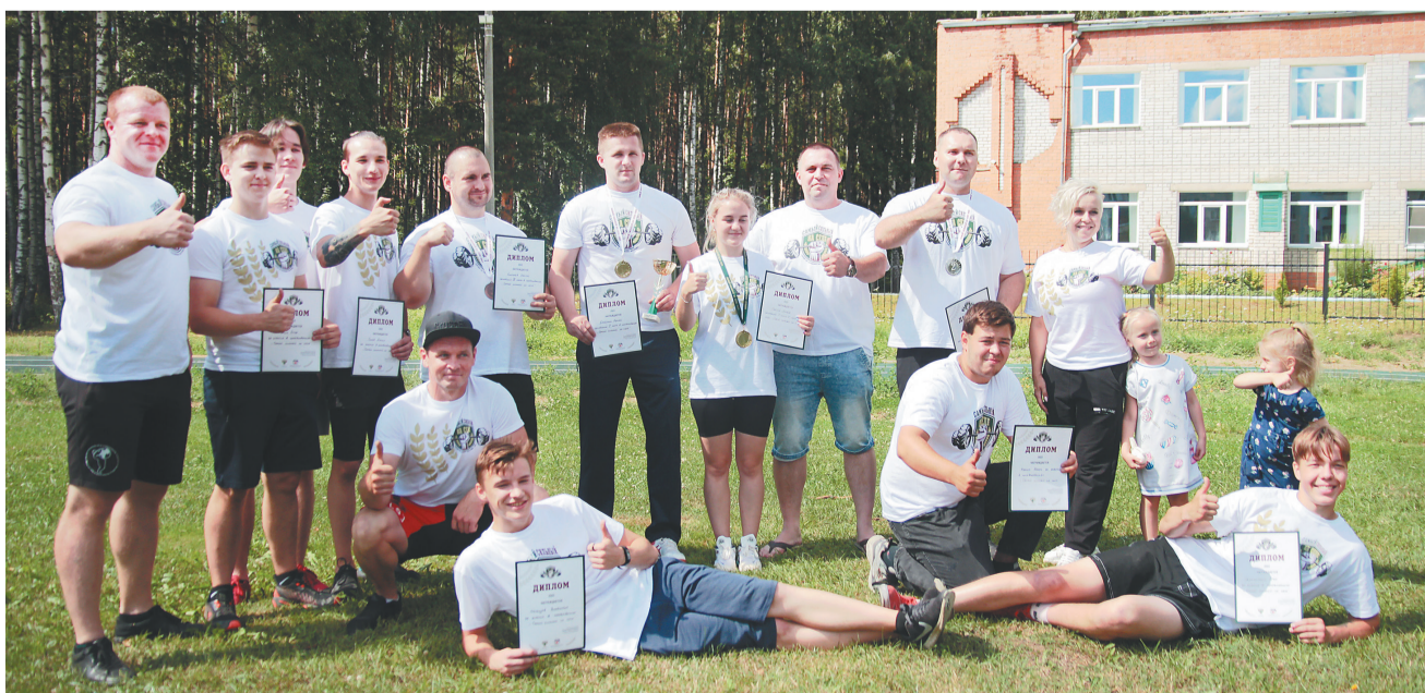
📷 Победители и призеры состязаний