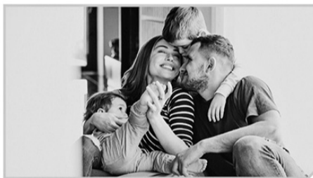
Преодоление трудной жизненной ситуации

мероприятий, направленных на преодоление гражданином трудной жизненной ситуации, в приоритетном порядке оказывается гражданам, проживающим в многодетных семьях и в семьях с детьми-инвалидами. По данному виду социального контракта предусмотрена ежемесячная выплата в размере прожиточного минимума для трудоспособных граждан, который составляет 14 263 рубля, и не более чем на шесть месяцев.