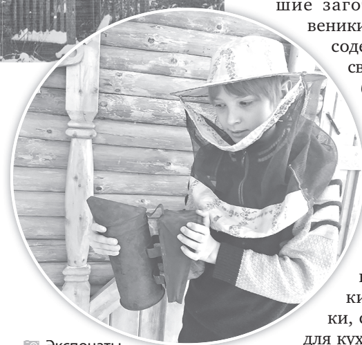
Экспонаты школьного музея – атрибуты пчеловода

Мы верим, что со временем на все вопросы найдем ответы. И в этом нам могут помочь читатели газеты «Ярославский агрокурьер».