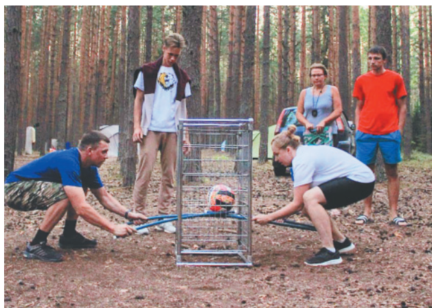
Один из конкурсов капитанов

Апофеозом стали соревнования по ночному ориентированию, которые сдобрены толикой театральности. У каждой команды оказались «похищены» красавицы. Их требовалось найти, ориентируясь по карте. Сложности добавляло то, что красавицу нужно