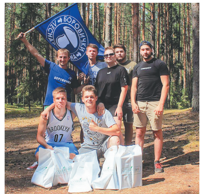
Команда «Боровички» из Лесной Поляны