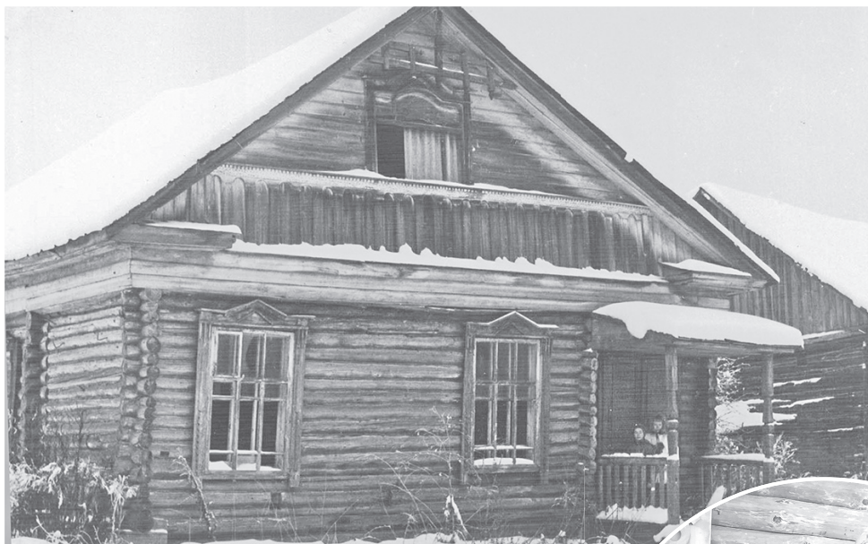
Сельский дом в деревне Васильево, в котором была школа