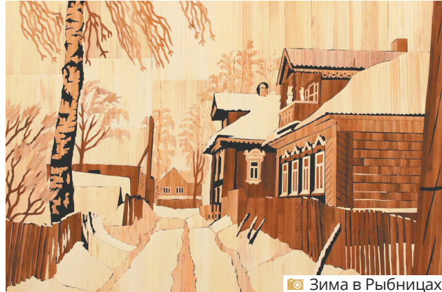
Зима в Рыбницах