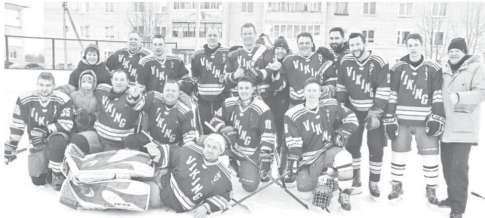
► Победители турнира на Кубок главы ЯМР