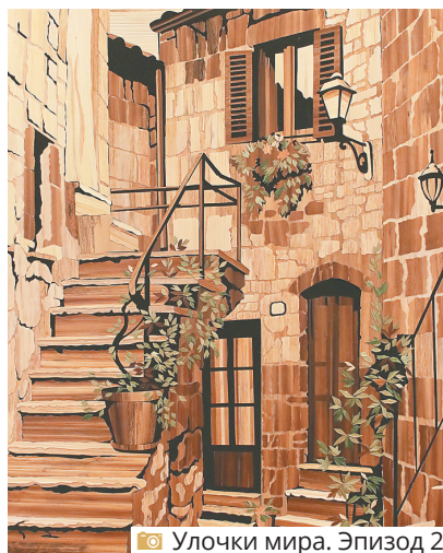
Улочки мира. Эпизод 2

– Основная работа начинается с рисунка, – рассказывает автор. – Его я делаю карандашом, фломастером или тушью. Разбиваю на отдельные детали, потом переношу на кальку. Заполняю плоскость каждой детали, приклеивая соломку, затем обрезаю по контуру, видному с обратной стороны. Планшеты для картин делаю сам, обтягиваю черной тканью и монтирую все детали.