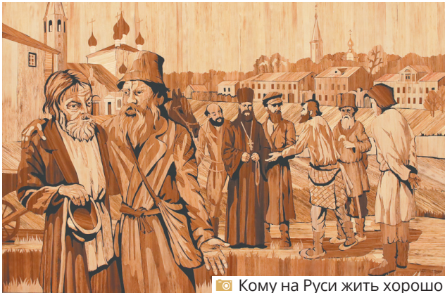
Кому на Руси жить хорошо