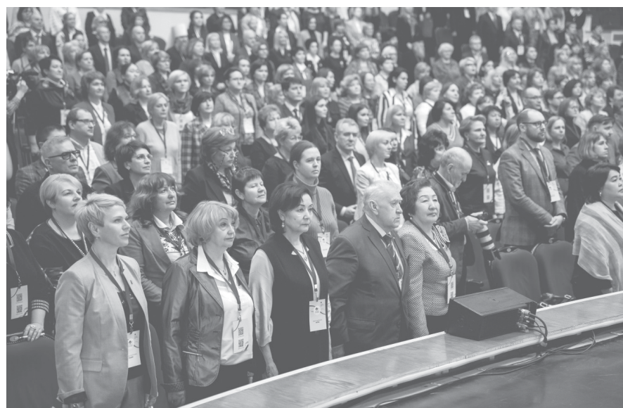
► В Ярославль съехались ведущие педагоги России

Ярославль стал центром формирования новой образовательной стратегии России