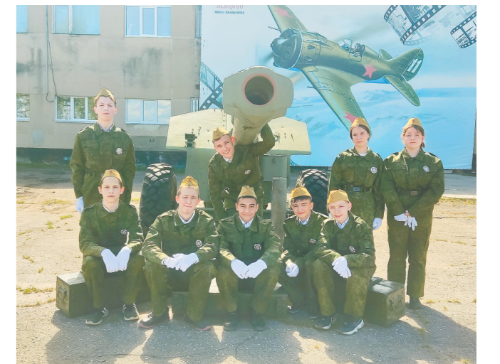
Сборная Карачихской школы на аэродроме «Левцово»