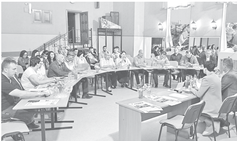
Участники выездного заседания