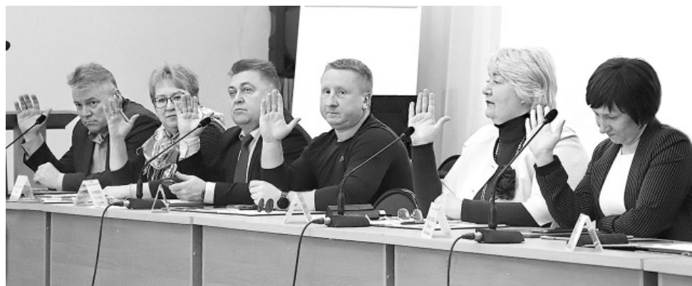
☞ Депутаты принимают решение

Предложено внести соответствующие изменения в Устав района и в связи с тем, что дорожная деятельность в отношении автомобильных дорог местного значения в границах населенных пунктов сельских поселений и обеспечение безопасности дорожного движения на них с 1 января этого года отнесены к полномочиям органов местного самоуправления ЯМР. С этой же даты к органам государственной власти Ярославской области отнесены полномочия органов местного