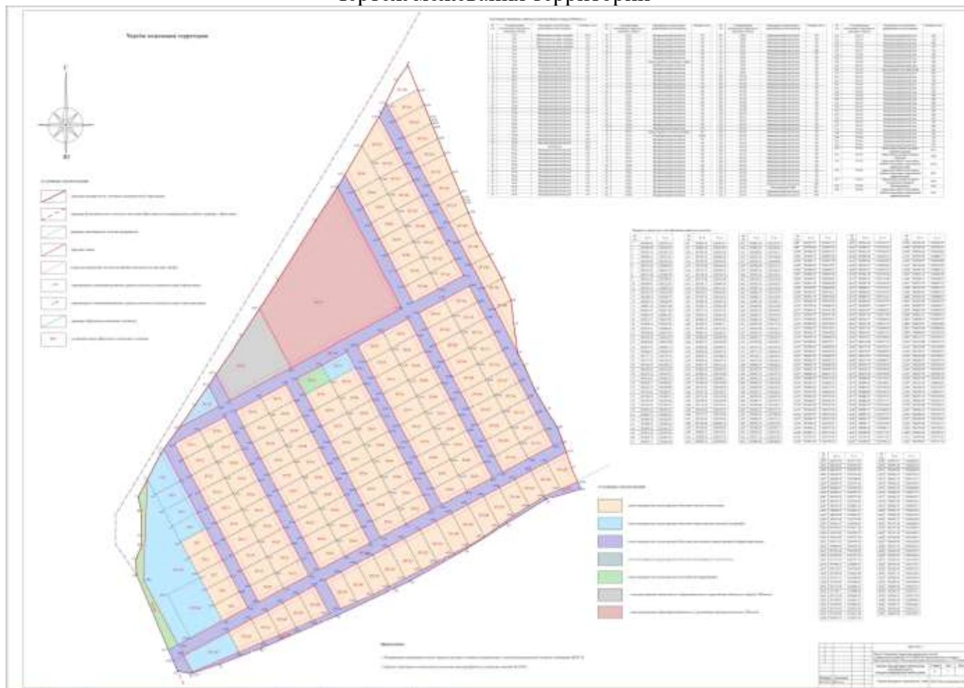
Чертеж межевания территории